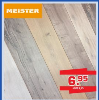
Vinyl-Fertigboden "Lärche Naturell" Deckmaß: 1220 x 185 mm Stärke: 10,5 mm